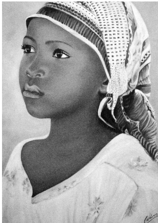
Pintura denominada 'María' de la serie 'África'. / DA

La obra Marcianitos está realizada a partir de una historia que Martínez se inventó y que se basa en los conflictos nacionalistas. "Se trata de una parejita de extraterrestres enamorados cuya nave averiada cae a la Tierra en un lugar llamado España. Aquí nace el primer español que tiene padres de origen marciano, con los mismos derechos sobre la tie-