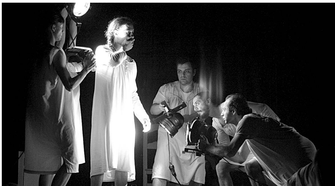
La obra Lost & Founds está realizada por tres compañías de compañías de Francia, Turquía y España. / DA

La pieza Lost & Founds , según explica una nota remitida por TDL, es la conclusión del trabajo que han venido desarrollando durante año y medio las tres compañías dentro del programa Cultura 2007-2013 de la Unión Europea, y también ha contado con la participación del Cabildo de Tenerife y el programa Septiembre del Gobierno de Canarias. Este espectáculo fue estrenado en el Auditorio de Tenerife el pasado mes de diciembre y tam-